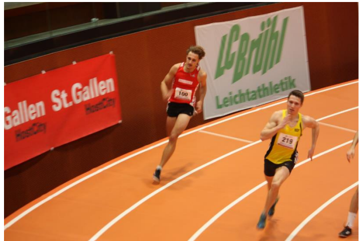
Silvan als Sprinter